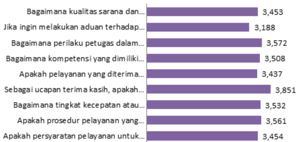
Gambar 2.1 Diagram Penilaian Evaluasi Layanan Administrasi Akademik PGSD Universitas Jambi Semester Genap 2020/2021

Lebih lanjut, hasil evaluasi ini dapat digambarkan melalui diagram berikut: