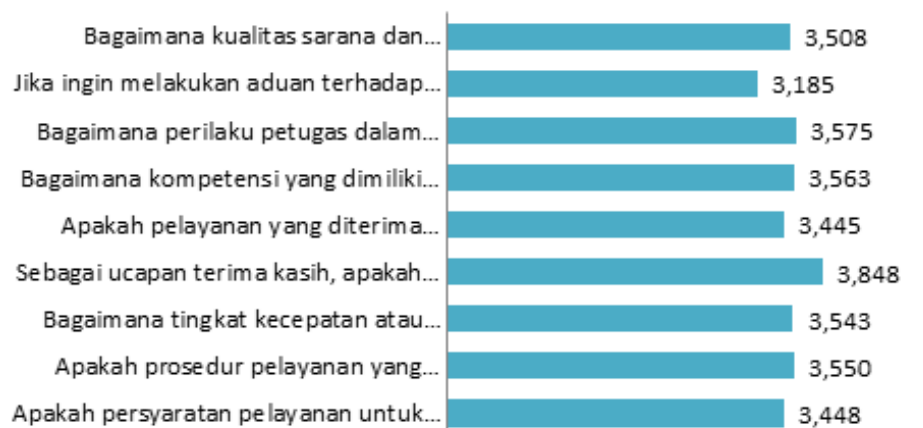
Gambar 2.1 Diagram Penilaian Evaluasi Layanan Administrasi Akademik PGSD Universitas Jambi Semester Gasal 2021/2022

Lebih lanjut, hasil evaluasi ini dapat digambarkan melalui diagram berikut: