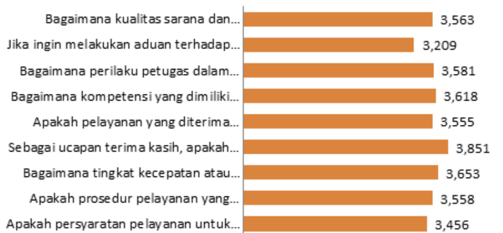
Gambar 2.1 Diagram Penilaian Evaluasi Layanan Administrasi Akademik PGSD Universitas Jambi Semester Genap 2021/2022

Lebih lanjut, hasil evaluasi ini dapat digambarkan melalui diagram berikut: