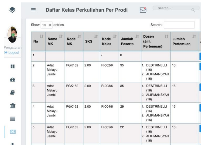
Gambar 1 Monitoring Perkuliahan